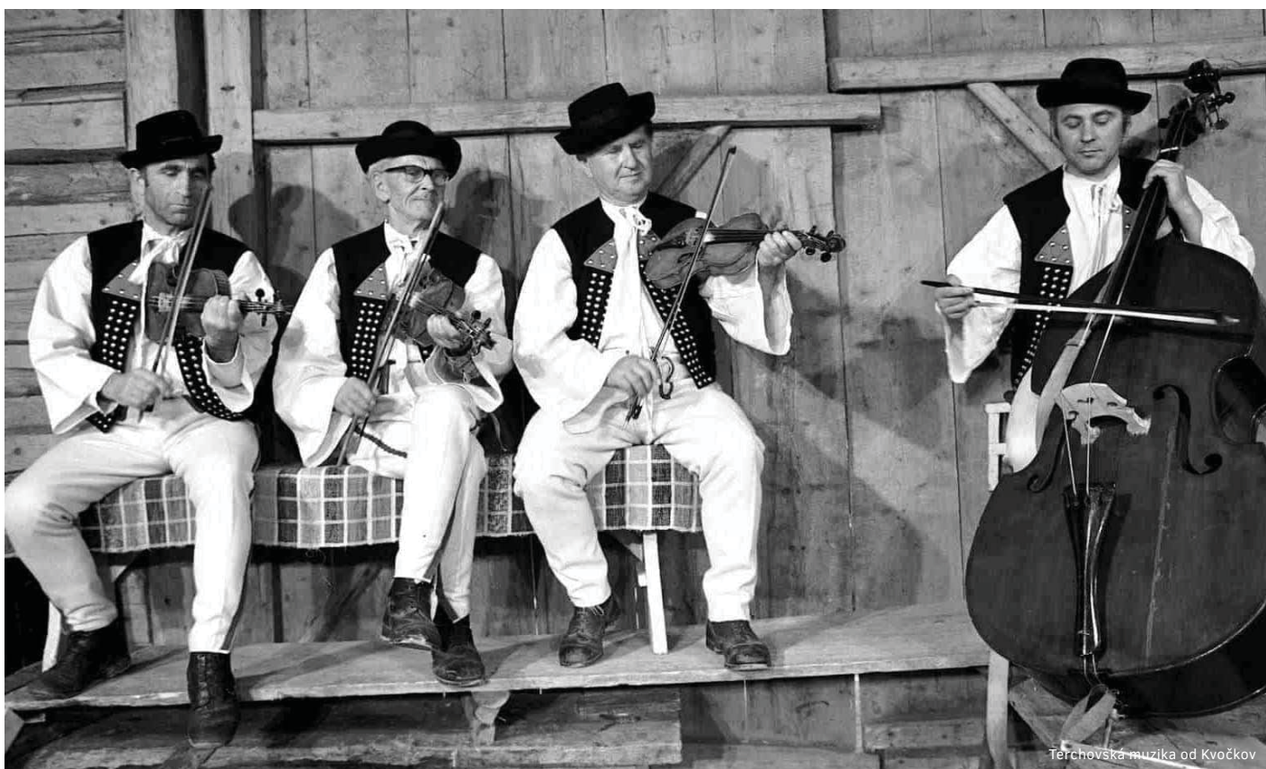
Terchovská muzika od Kvočkov