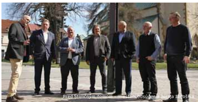
Pred Stoličným domom – miestom odsúdenia Juraja Jánošíka