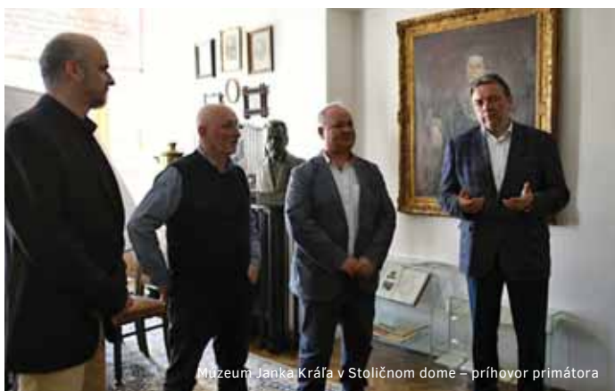
Múzeum Jána Kráľa v Stoličnom dome – príhovor primátora