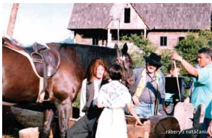
...zábery z natáčania