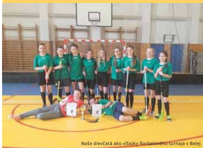
Naše dievčatá ako víťazky florbalového turnaja v Beleji