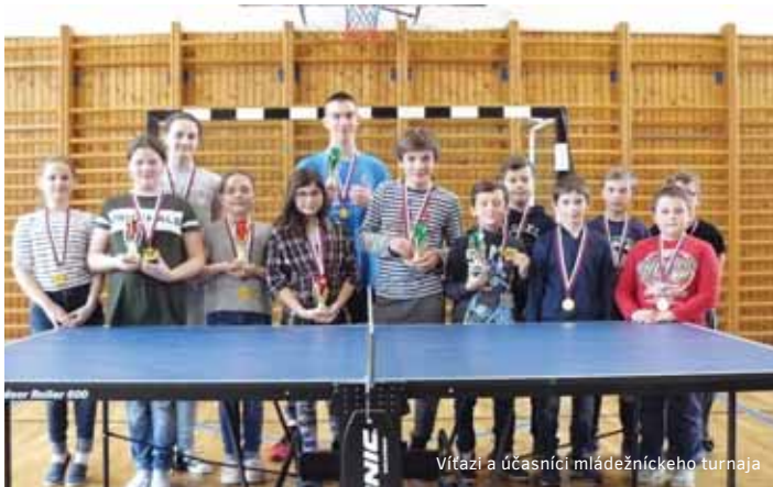
Vítazi a účastníci mládežníckeho turnaja