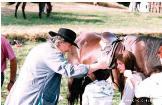
...Nejasná správa o konci sveta