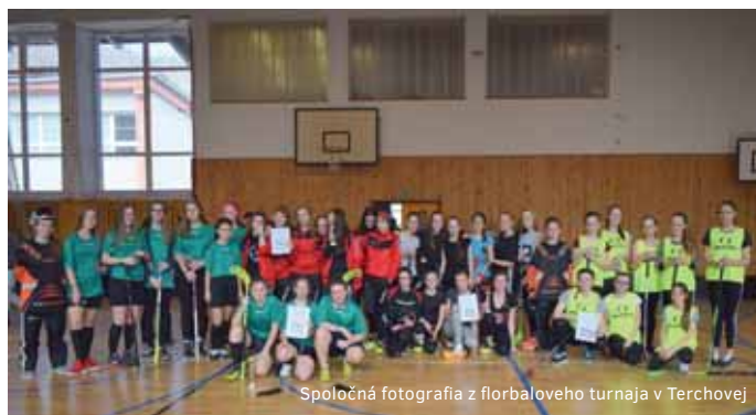
Spoločná fotografia z florbalového turnaja v Terchovej