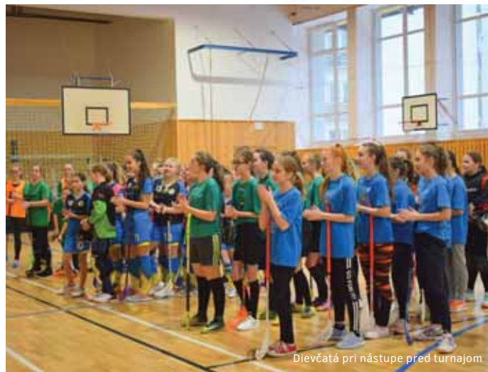
Dievčatá pri nástupe pred turnajom