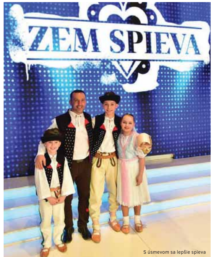
S úsmevom sa lepšie spieva